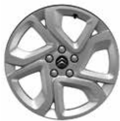
Lichtmetaal 17" ELLIPSE 215/65 R17