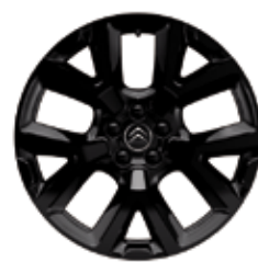
Lichtmetaal 19" ART Black 205/55 R19