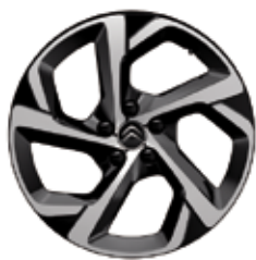
Lichtmetaal 18" SWIRL 235/55 R18