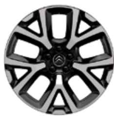
Lichtmetaal 19" ART 205/55 R19