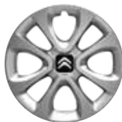
Staal 15" ARROW