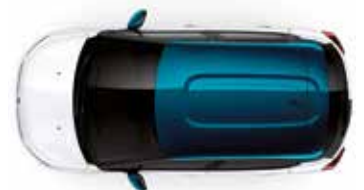
Two Tone Emerald