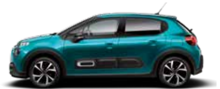
Spring Blue (parelmoer)