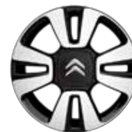
Lichtmetaal 16" Diamantée MATRIX