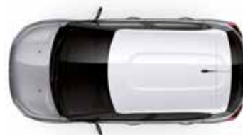
Two Tone Opal White