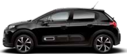
Perla Nera Black (parelmoer)