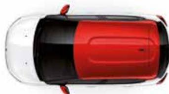
Two Tone Sport Red