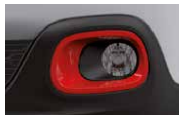
Pack Color Sport Red