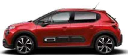
Elixir Red (parelmoer)