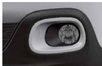
Pack Color Opal White