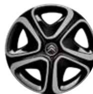
Staal 16" STEEL & STYLE 3D