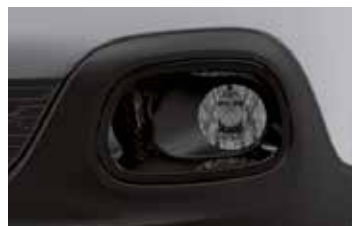
Two Tone Perla Nera Black