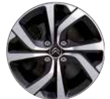
Lichtmetaal 17" Diamantée VECTOR