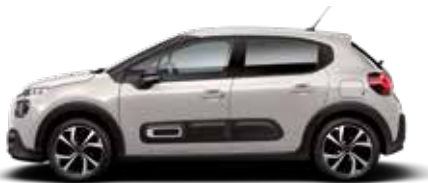
Soft Sand (parelmoer)