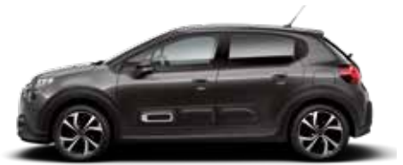
Platinum Grey (metallic)