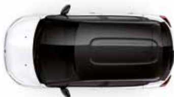
Two Tone Perla Nera Black