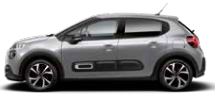
Steel Grey (metallic)