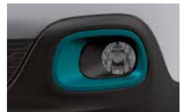
Pack Color Emerald